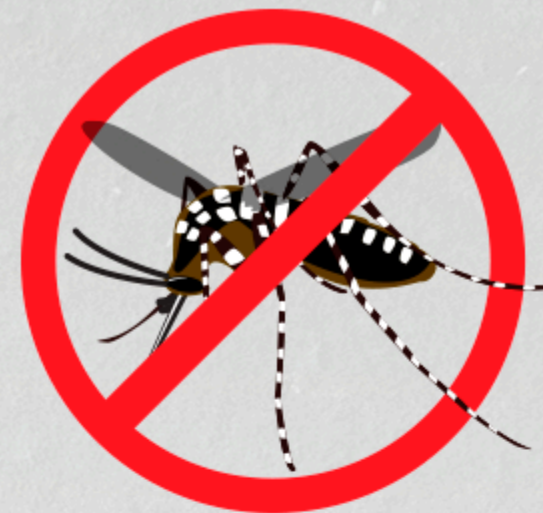
CASOS CONFIRMADOS DE DENGUE POR BAIRRO - 2024