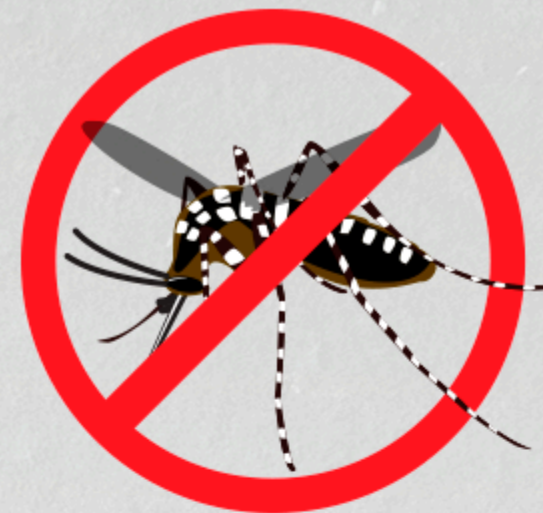
CASOS CONFIRMADOS DE DENGUE POR BAIRRO - 07/2023 - 04/2024 - RESIDENTES DE PATO BRANCO